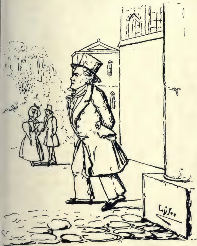
Beethoven. Karikatur von Lyser